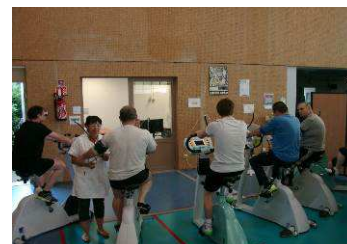
Unité de réadaptation cardio-vasculaire