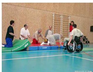
Activité physique adaptée