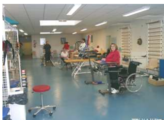
Salle de rééducation